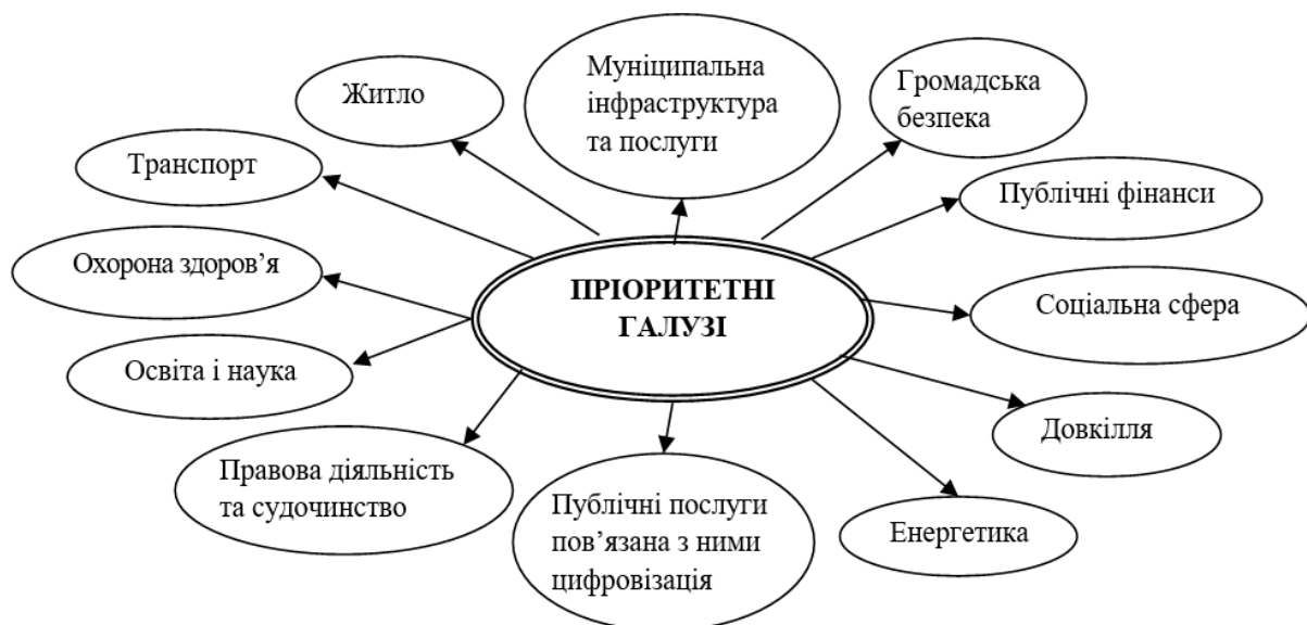
Рис. 2. Пріоритетні галузі (сектори), які визначені «Середньостроковим планом для публічного інвестування у 2026–2028 рр.» [12]

Формування переліку пріоритетних галузей публічного інвестування на період дії середньострокового плану здійснювалося з урахуванням актуальних потреб і стратегічних орієнтирів держави, а також її інституційних і фінансових можливостей (рис. 2).