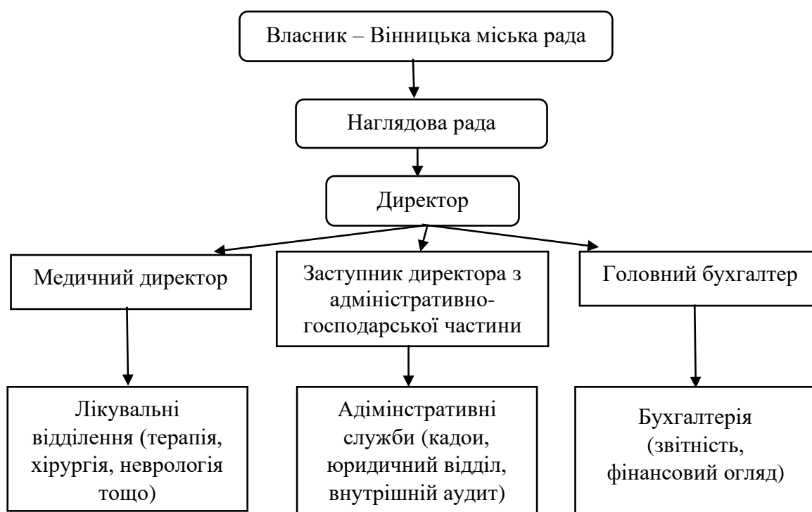
Рис. 2.1. Організаційна структура КНП «Вінницька міська клінічна лікарня №1»

КНП «ВМКЛ №1» має розгалужену організаційну структуру, яка охоплює понад 10 клінічних відділень, допоміжні служби, консультативну поліклініку та адміністративно-управлінський підрозділ (рис. 2.1). Загальна кількість ліжок становить 465 одиниць, що дозволяє забезпечити лікування широкого спектра хвороб внутрішніх органів, хірургічного профілю, а також надання ургентної допомоги. Станом на 2024 рік у закладі працює понад 1117 працівників, з яких близько 240 – це лікарі, понад 350 – середній медичний персонал, а решта – молодші медичні працівники, технічні та обслуговуючі служби.