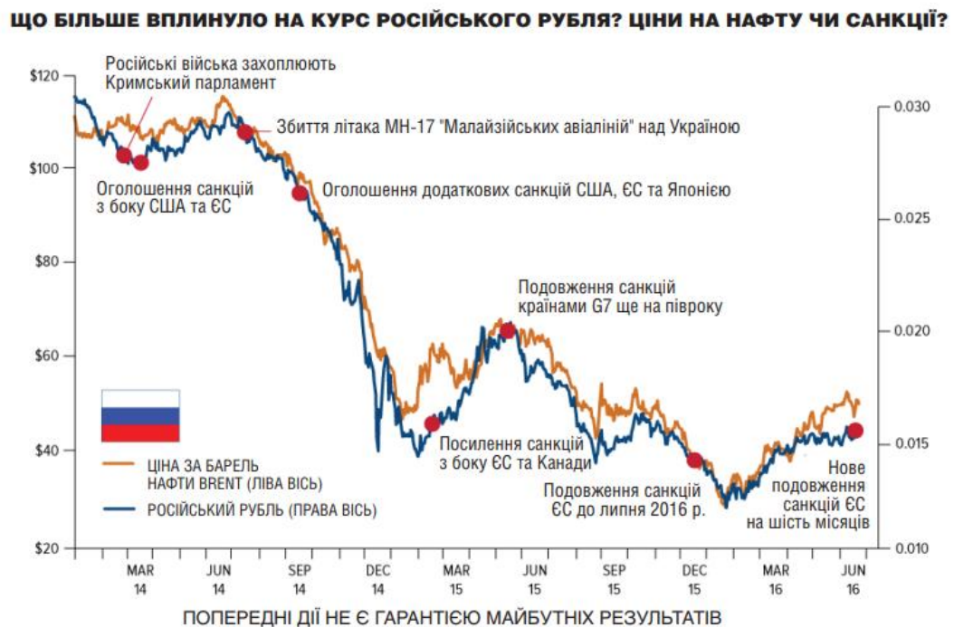
Рис. 3.2.1. Вплив санкцій на РФ [51].

Необхідно визнати, що оцінка ефективності санкцій, введених проти Росії, є предметом постійних обговорень і перевірок в академічних колах. Вплив санкцій на політику та поведінку Росії, а також її здатність досягати запланованих результатів і змінювати геополітичну динаміку підлягають різним точкам зору та тлумаченням.