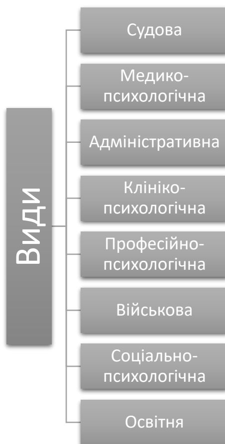
Рисунок 1.1. Різновиди психологічної експертизи [39]

Психологічна експертиза має різні типи, залежно від завдань, які перед нею ставляться, і від об'єктів, які досліджуються. Основними об'єктами виступають особистість людини, її психічні процеси, емоційні стани, поведінкові моделі, а також міжособистісні й соціальні взаємодії, що відображаються у її діяльності. Наприклад, в експертизах, що пов'язані з оцінкою дієздатності або осудності, об'єктом виступає здатність суб'єкта розуміти значення своїх дій та керувати ними. В експертизах, пов'язаних із сімейними конфліктами, насильством, булінгом або іншими гуманітарними проблемами, об'єктом є психоемоційні стани, конфліктогенні чинники, рівень емоційної регуляції, схильність до девіацій тощо [12].