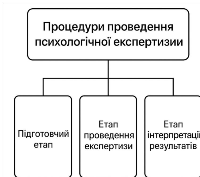
Рис. 2.2. Процедури проведення психологічної експертизи [41]

У гуманітарному форматі особливу увагу приділяють мові висновку: вона повинна бути зрозумілою для неспеціалістів, позбавленою стигматизуючих формулювань, точна у змісті, лаконічна за структурою, гнучка щодо можливих подальших інтерпретацій. Формулювання мають бути достатньо конкретними, щоб відповідати на поставлені питання, але при цьому не виходити за межі психологічної компетенції. Уникається фіксування остаточних оцінок поведінки, натомість пропонуються моделі її пояснення, варіанти впливу, рекомендації щодо подальшої підтримки або супроводу.