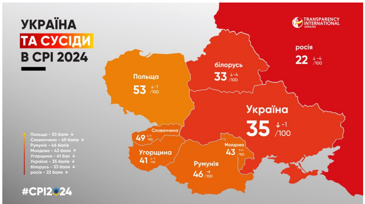
Рис 3.1. Індекс сприйняття корупції 2024р.