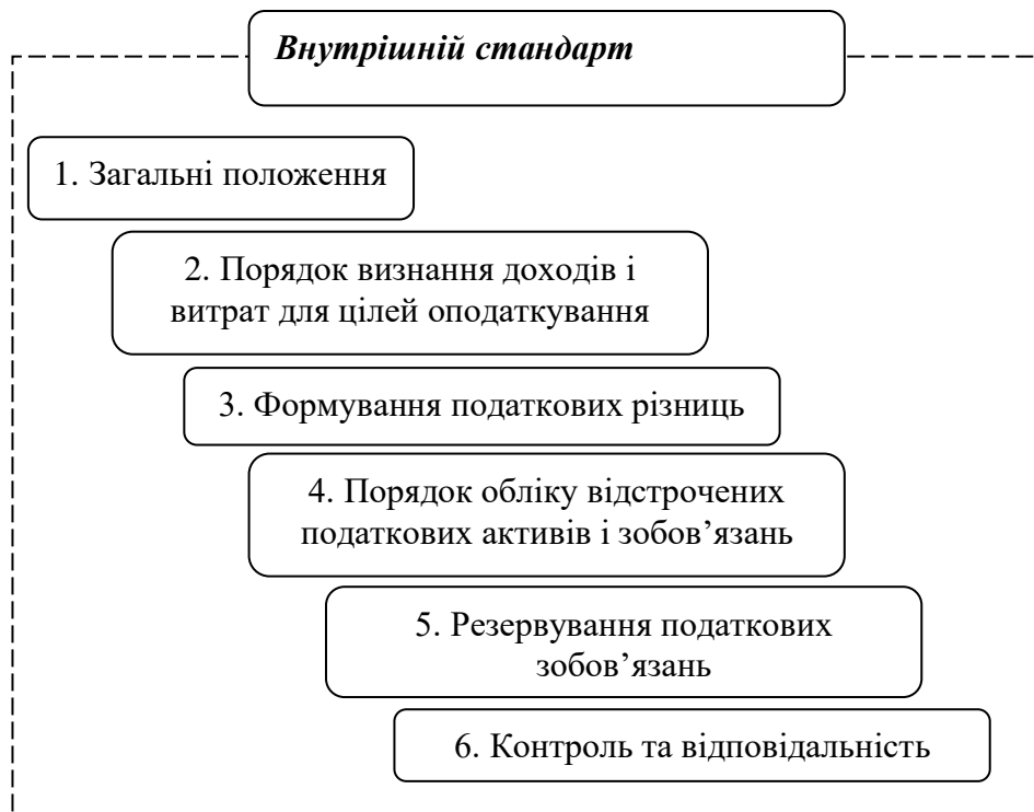
Рис. 3.1. Основні розділи внутрішнього стандарту з обліку податку на прибуток