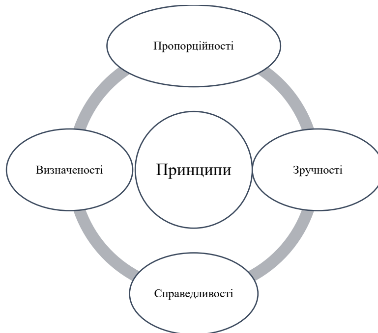
Рис.1.1. Основні принципи оподаткування за А. Смітом

Основні принципи оподаткування, сформульовані Адамом Смітом, вважаються класичними засадами фіскальної політики та слугують фундаментальною основою для конструювання сучасних податкових систем економічно розвинених держав. До них належать принципи пропорційності оподаткування, визначеності, зручності та справедливості, які забезпечують логічність, передбачуваність і збалансованість податкових відносин у суспільстві. (рис. 1.1).