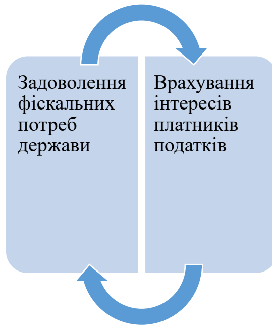
Рис. 1.2. Узгодженість принципів системи оподаткування

Таким чином, принципи оподаткування виконують визначальну функцію у формуванні дієвої податкової системи, здатної водночас гарантувати фінансову стійкість держави та стимулювати економічний розвиток. Це досягається шляхом узгодження інтересів державних інституцій і платників податків, що, власне, і становить основу соціально-економічного поступу будь-якої країни.