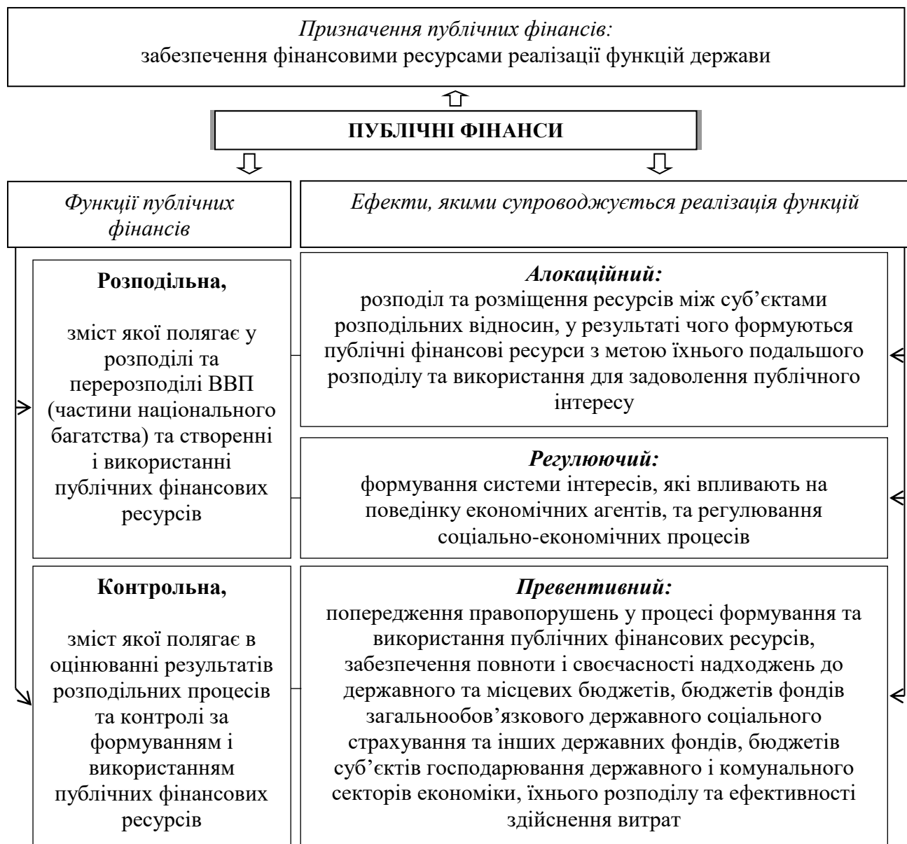
Рис. 2. Призначення, іманентні функції публічних фінансів та ефекти, якими супроводжується їхня реалізація

Отже, запропонований концептуальний підхід до дефініції «публічні фінанси», виявлення й обґрунтування алокаційного, регулюючого і превентивного ефектів від реалізації розподільної та контрольної функцій публічних фінансів як економічної категорії дасть змогу обґрунтувати призначення публічних фінансів з метою визначення їх впливу на соціально-економічні процеси та підвищення ефективності управління публічними фінансовими ресурсами.