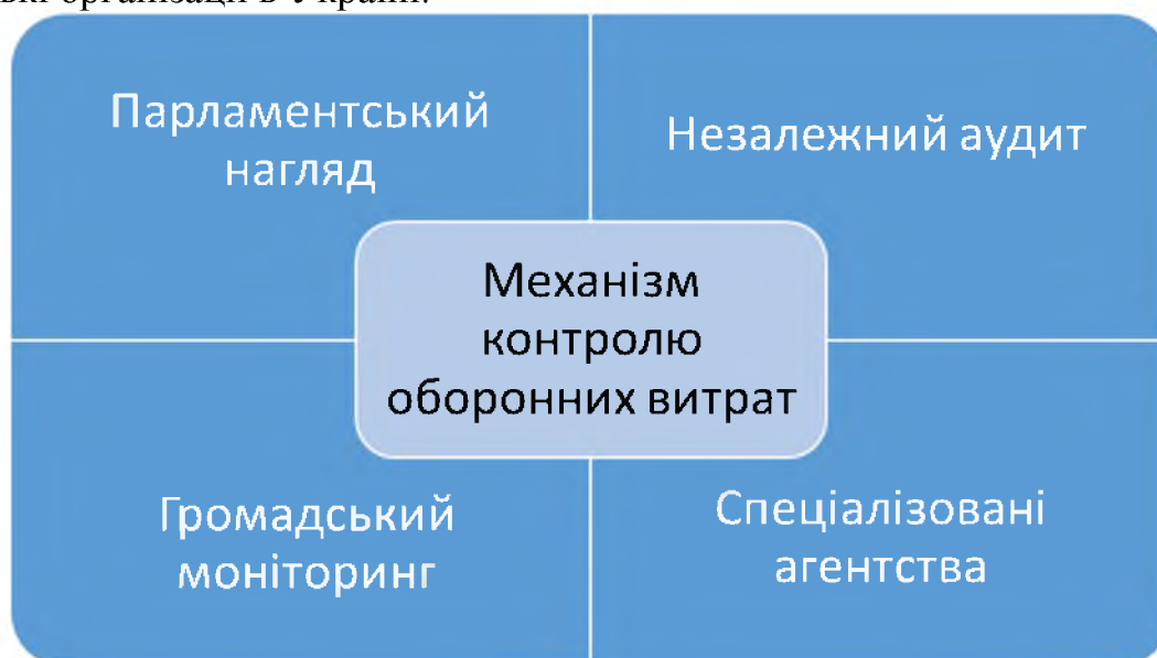
Рис. 2. Схема базових механізмів контролю за оборонними витратами у провідних країнах світу*

Причому у контексті тематики нашого дослідження важливо акцентувати, що відповідний контроль за витратами на сектор оборони зарубіжних країн здійснюється через: парламентський нагляд; незалежний аудит; громадський моніторинг; спеціалізовані агентства (рис. 2). Скажімо, такими агентствами є: GAO у США, NAO у Великій Британії, Bundesrechnungshof у Німеччині, NIK у Польщі, State Comptroller в Ізраїлі, Головна інспекція Міністерства оборони і громадські організації в Україні.