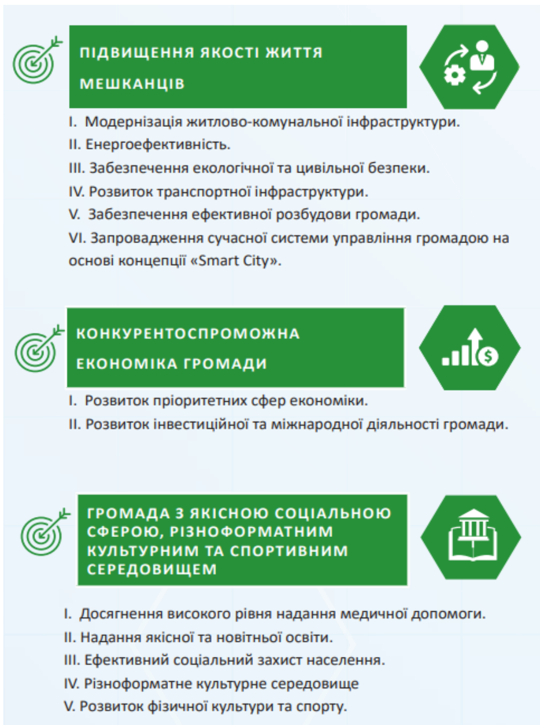
Рис.3.1 Стратегічні цілі розвитку Тернопільської громади до 2029р.