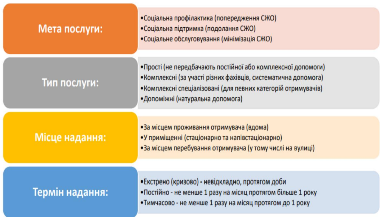
Рис.1.1. Класифікація соціальних послуг населенню територіальної громади