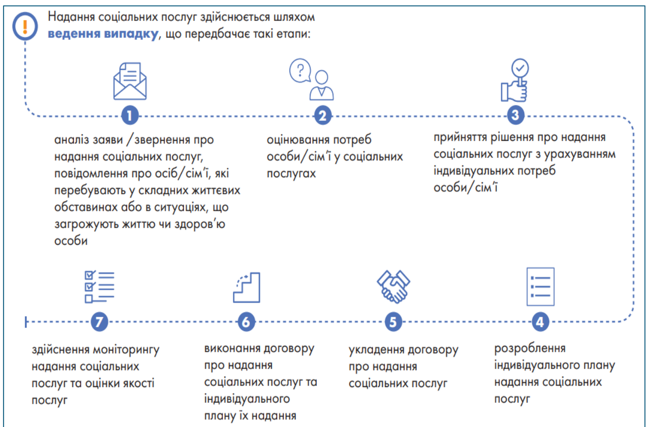
Рис.1.2. Алгоритм надання соціальних послуг

КМУ затверджує порядок надання соціальних послуг. Загальний алгоритм їхнього надання охоплює декілька етапів (рис.1.2).