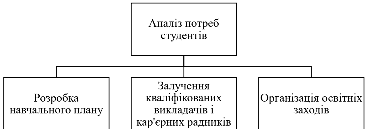
Рисунок 2.1. Основні заходи реалізації запропонованої програми

Всі вище перераховані рекомендації можна узагальнити в таблиці (Рис 2.1.).