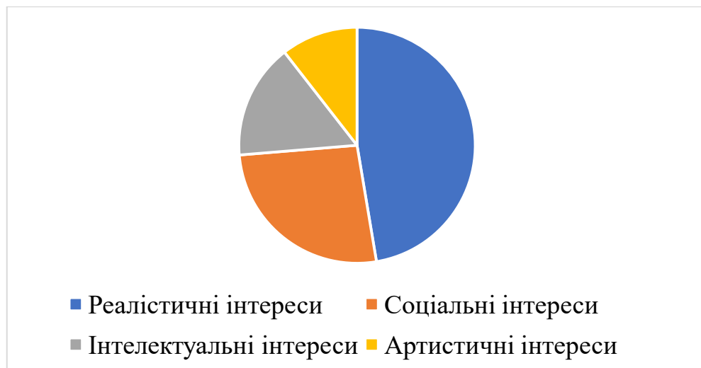
Рисунок 2.2. Аналіз типів інтересів

Соціальні інтереси, з іншого боку, можуть вказувати на бажання спілкуватися з людьми, допомагати їм або працювати в команді. Професії, пов'язані з цими інтересами, можуть включати в себе соціальну роботу, освіту, медицину, психологію, громадську діяльність і багато інших сфер, де міжособистісні навички та спілкування з групами людей є важливими (Рис. 2.3.).