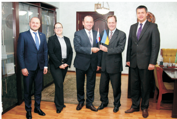
А. Г. Крисоватий зустрівся з Надзвичайним та Повноважним Послом Республіки Хорватія в Україні Томіславом Відошевічем (грудень 2015)