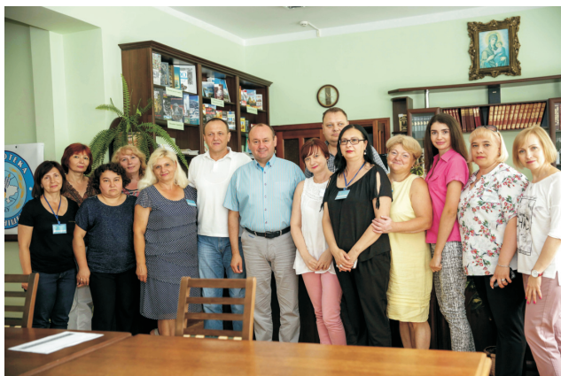
Зустріч ректора з працівниками бібліотеки і.м. Л. Каніщенка (липень 2018)