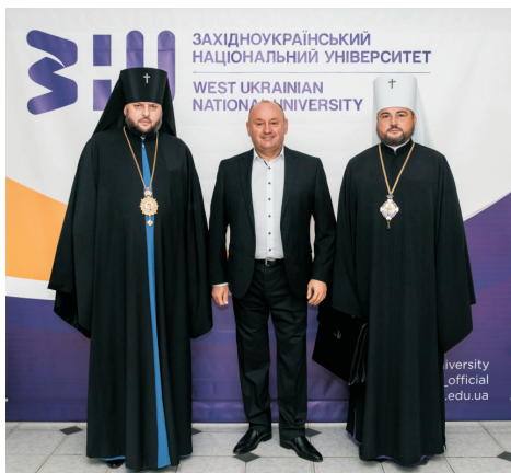
До університету завітали духовні наставники – митрополит Переяславський і Вишневський Олександр та архієпископ Тернопільський і Бучацький Тіхон (жовтень 2021)