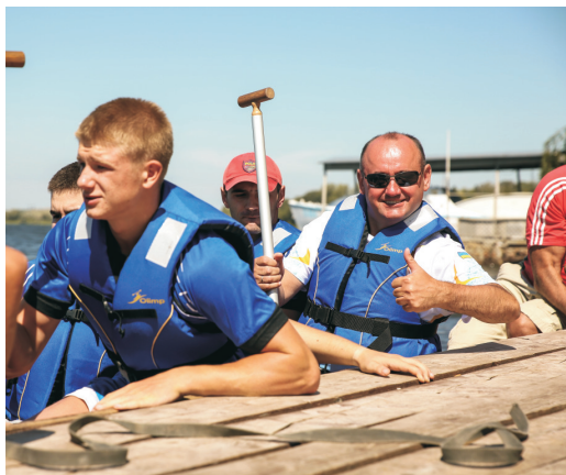
Команда ТНЧЕУ взяла участь у змаганнях на драгонботах (серпень 2018)