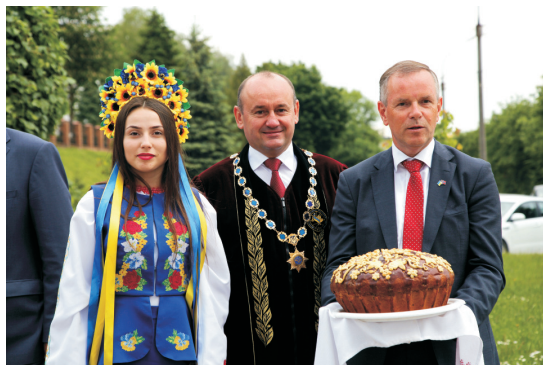
Зустріч з Надзвичайним і Повноважним Послом Королівства Норвегія в Україні Уле Тєр'є Хорпест (травень 2017)