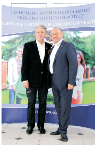
Візит В. Ющенка до ТНЕУ (жовтень 2016)