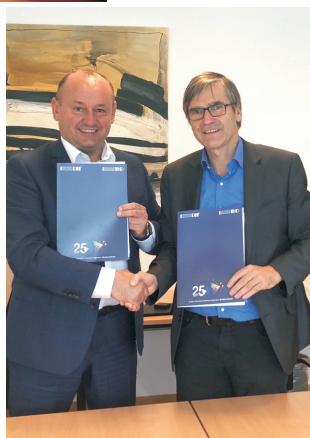
Візит делегації ПІФЕУ до Деггендорфського технологічного інституту (Німеччина) (серпень 2019)