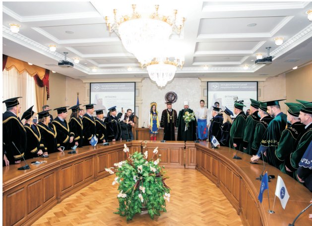
Присвоєно звання «Почесний професор Західноукраїнського національного університету» Блаженнійшому Епіфанію (травень 2021)