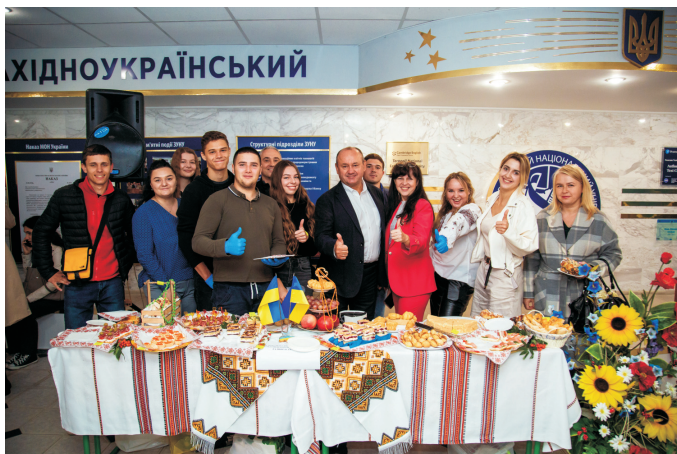
Благодійний ярмарок «Разом до перемоги!» (вересень 2022)