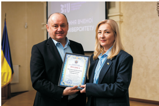
Подяка колективу ЗУЧУ від Тернопільського обласного центру зайнятості (січень 2025)