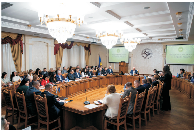
Підсумкове засідання Вченої ради ЗУДУ (грудень 2024)