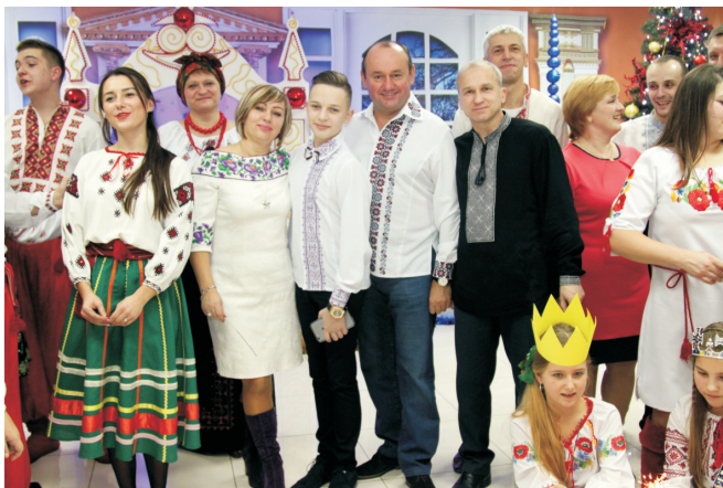
Андріївські вечорниці (грудень 2015)