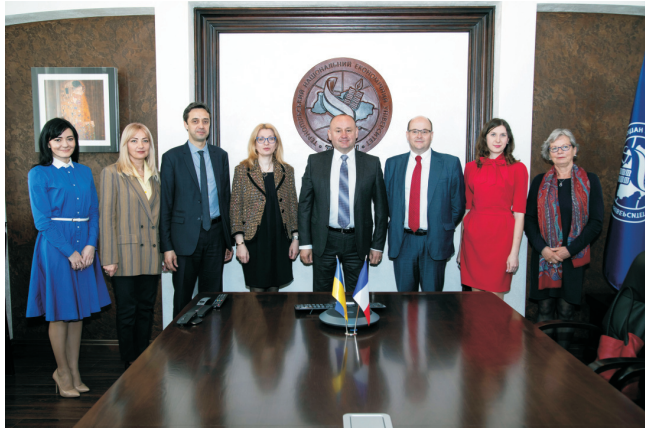
Візит до ПЧЕУ представників Посольства Франції в Україні (квітень 2019)