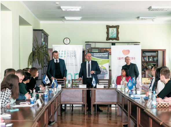
XIV Всеукраїнська студентська науково-практична конференція «Фіскальна політика України в умовах євроінтеграційних процесів» в бібліотеці і.м. Л. Каніщека ЗУФНУ (квітень 2019)