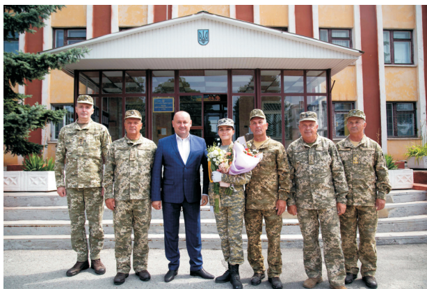
Випуск слухачів Центру підготовки офіцерів запасу класичного університету Тернополя (липень 2021)