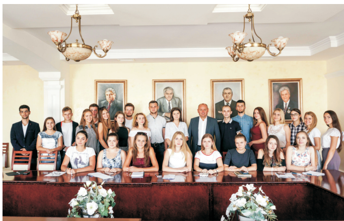
Зустріч ректора з молоддю університету (вересень 2018)