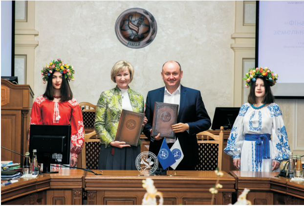
Співпраця з Університетом банківської справи (травень 2021)