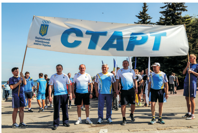
Участь у легкоатлетичному пробігу «Університетська миля» (травень 2017)