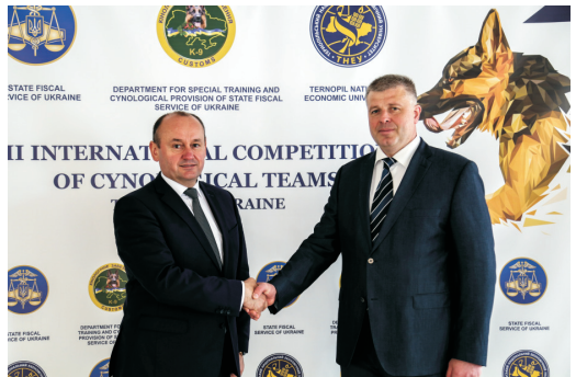
У ТНУ завітав з робочим візитом директор департаменту спеціалізованої підготовки та кінологічного забезпечення ДФС А. Д. Войцешук (травень 2017)