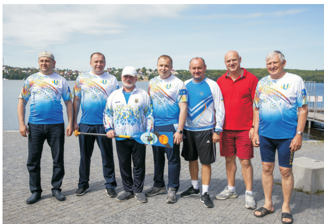
Кубок Спортивної студентської спілки України з веслування на драгонботах «Університетська морська миля» (червень 2019)