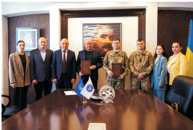
Співпраця із Адміністрацією Державної служби спеціального зв'язку та захисту інформації України (березень 2023)