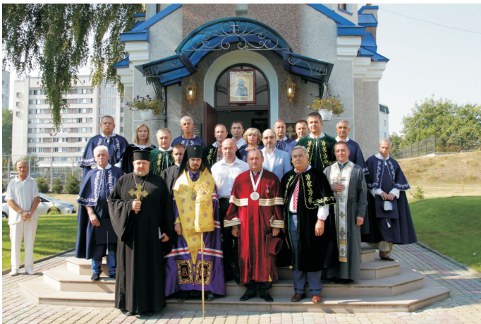
Урочисте благословення перед початком навчального року (вересень 2015)