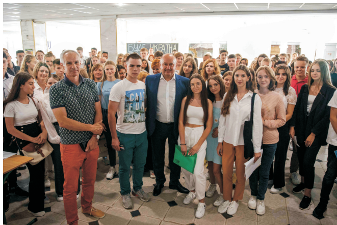
Зустріч з молоддю та батьками абітурієнтів (липень 2022)

Ректору Нідерландської бізнес-академії, президенту Міжнародної Асоціації медіації Яну ван Звітену присвоєно почесне звання «Doctor Honoris Causa» (листопад 2022)