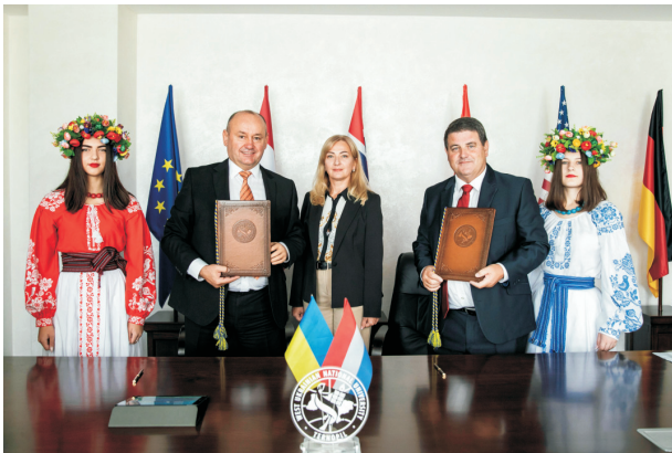
Підписання меморандуму про співпрацю між ЗУЧУ та Нідерландською бізнес-академією (вересень 2021)