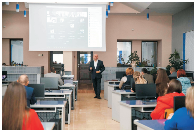
Наукові читання ім. С. ґ. Юрія (листопад 2023)