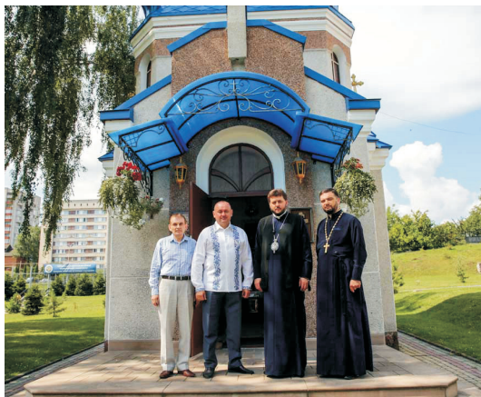
Зустріч з Єпископом Тернопільської єпархії УАПЦ Владикою Тихоном (липень 2018)