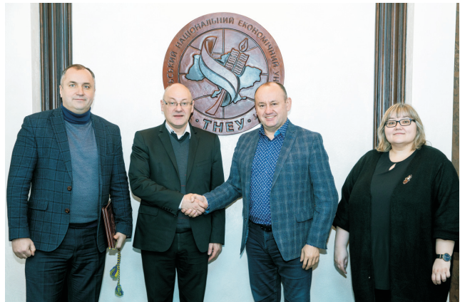
До ПЧЕУ завітала делегація Вармінсько- Мазурського університету в Ольштині (Республіка Польща) (січень 2020)