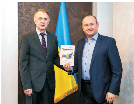
Надзвичайний та Повноважний Посол В. Огризко відвідав класичний університет Тернополя (жовтень 2022)