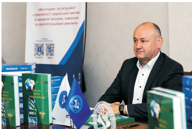
Презентація наукового видання «Сучасна митна енциклопедія» (травень 2025)