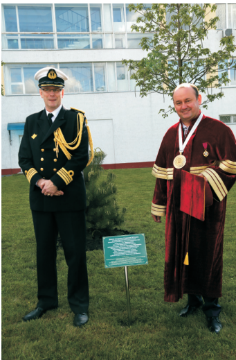
У стінах альма-матер вітали почесного гостя – Військового Аташе Королівства Норвегія Ханса Петтера Мідттуна (травень 2016)