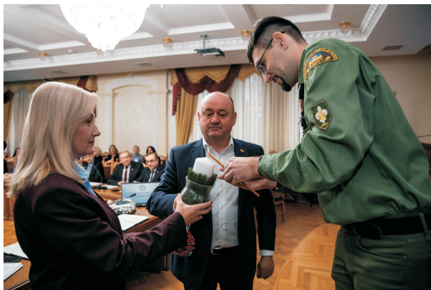
Національна скаутська організація «Пласт» передає Вислелемський Вогонь Миру (грудень 2024)