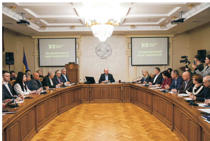
Урочисе засідання Вченої ради класичного університету Тернополя (січень 2025)