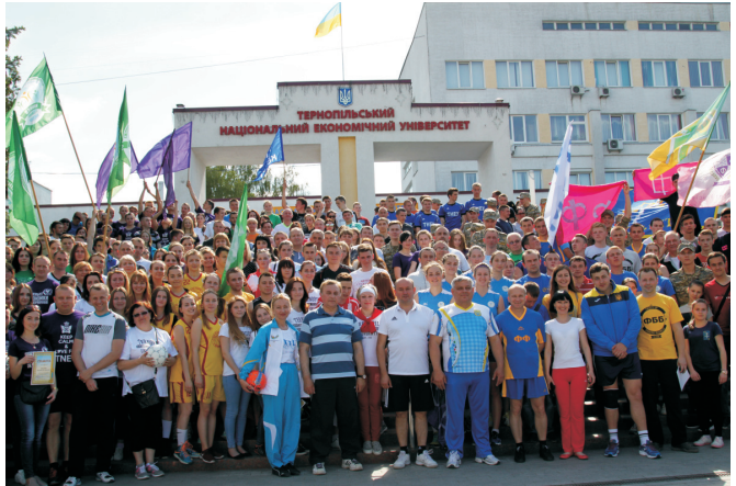
Академічна родина ТНУ в спортивному заході «Університетська мілья» (травень 2016)