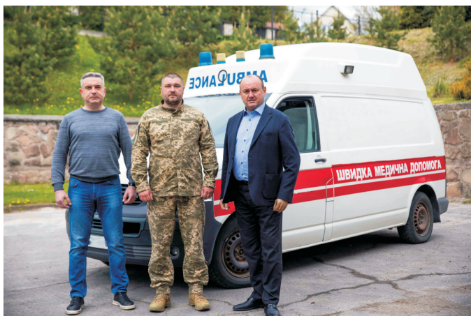
Автомобіль швидкої допомоги на передову (травень 2022)