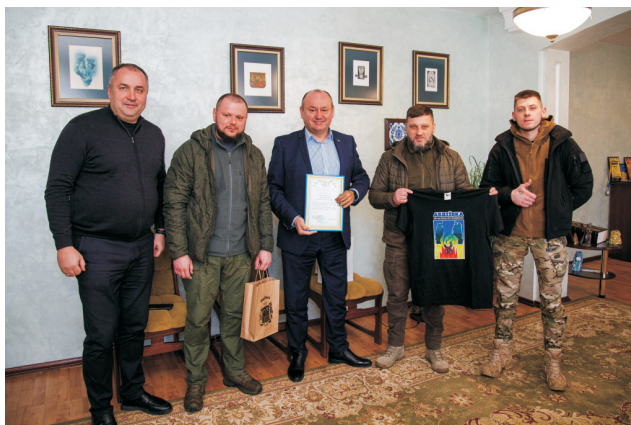
Співпраця із Авдіївською МВА (лютий 2023)