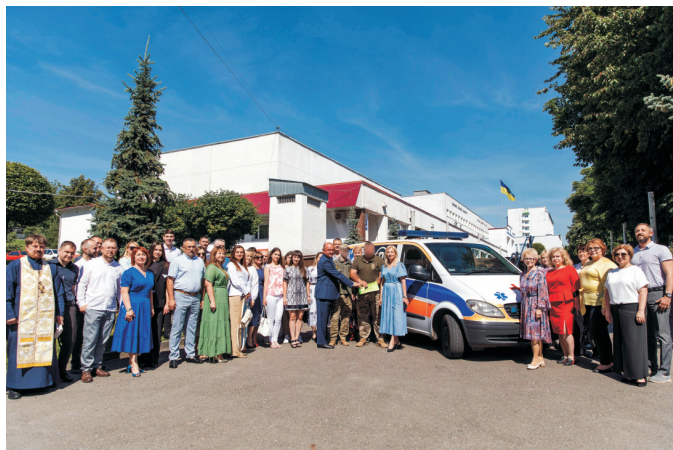
Автомобіль швидкої допомоги для ЗСУ (червень 2024)