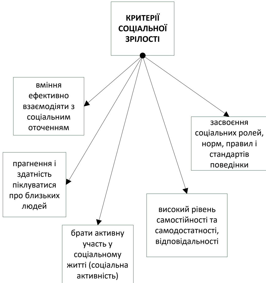
Рис. 1.1. Критерії соціальної зрілості

самовизначенні та соціальній активності, оскільки вони визнаються невід’ємною частиною феномена громадянської та особистісної діяльності [34].