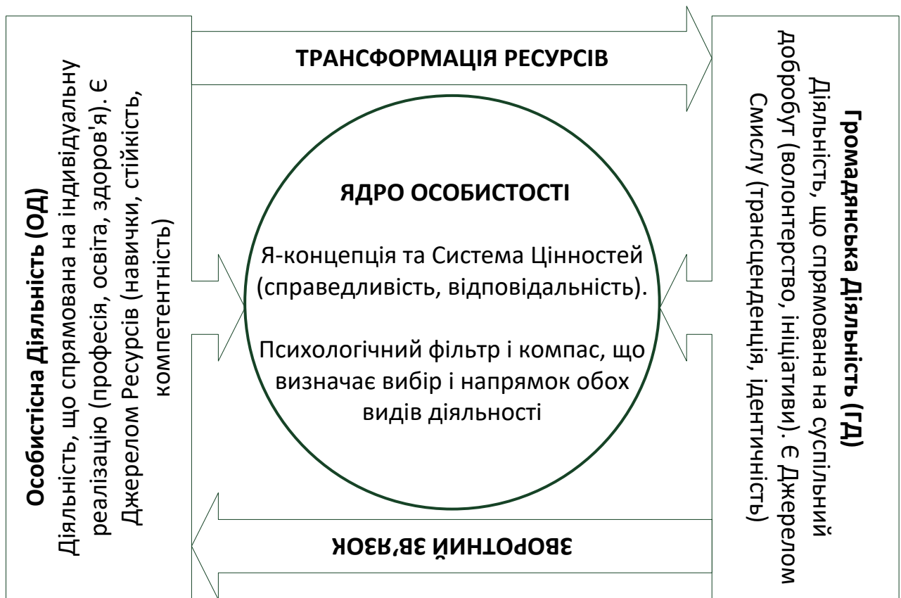
Рис. 3.1. Психологічна модель взаємозв'язку громадянської та особистісної діяльності

цю енергію на ширші соціальні контексти. При цьому цінності – справедливість, свобода, відповідальність, повага до інших – постають своєрідним «мотиваційним містком», що забезпечує перехід від особистого до громадського рівня.