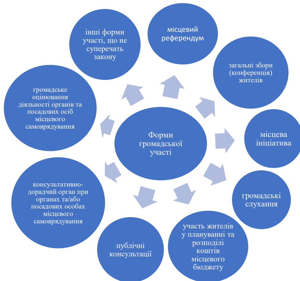
Рис. 1.1. Основні правила та норми етики публічних службовців

На Рисунку 1.1 наведено основні форми участі у вирішенні питань місцевого значення, які прописані у Законі України «Про місцеве самоврядування».