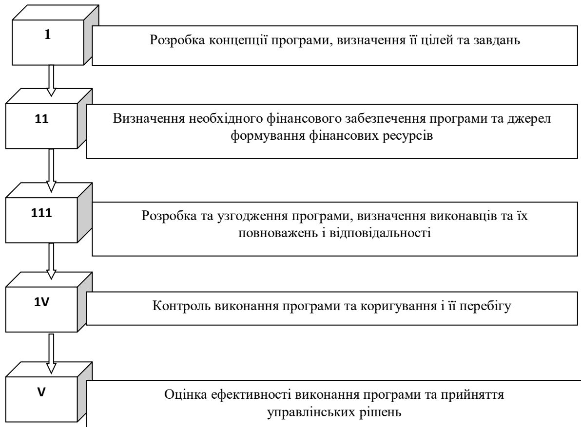
Рис. 3.3. Схема розробки та реалізації програми соціально-економічного розвитку регіону

Розробка та реалізація програми передбачає практичну реалізацію декількох послідовних етапів (рис. 3.3).