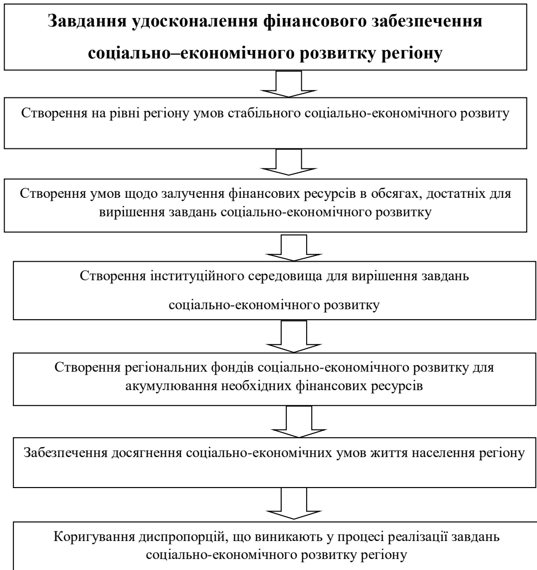
Рис. 3.1. Завдання фінансового забезпечення соціально-економічного розвитку регіону

- побудова відповідного дієвого фінансового механізму забезпечення соціально-економічного розвитку регіону із застосуванням системи економічних показників та фінансових інструментів його практичної реалізації.