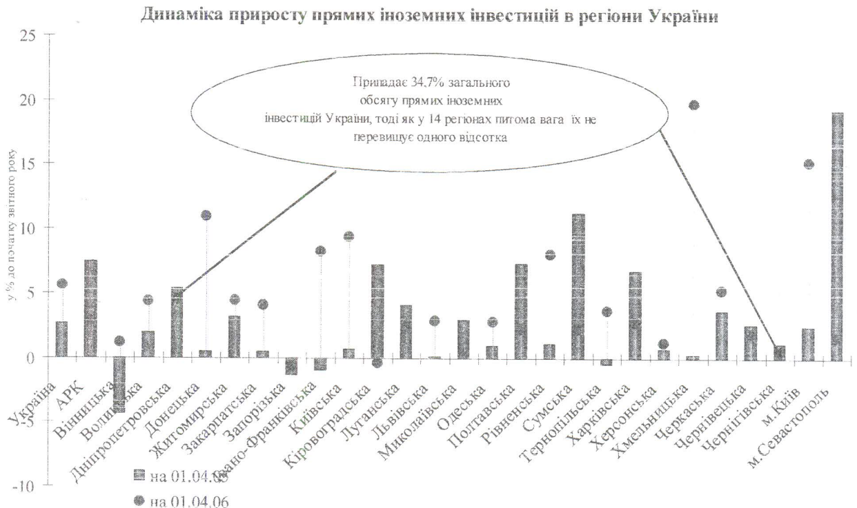
Рис. 2 Динаміка приросту прямих іноземних інвестицій в регіони України

Збільшилася регіональна асиметрія за інвестиціями в основний капітал. Водночас регіони помітно відрізняються за можливостями щодо залучення інвестицій. У I кварталі 2006 року спостерігалось зростання прямих іноземних інвестицій у 25 регіонах, у 6 з яких їх приріст перевищував середній показник по Україні (5,6%) (Рис. 2).