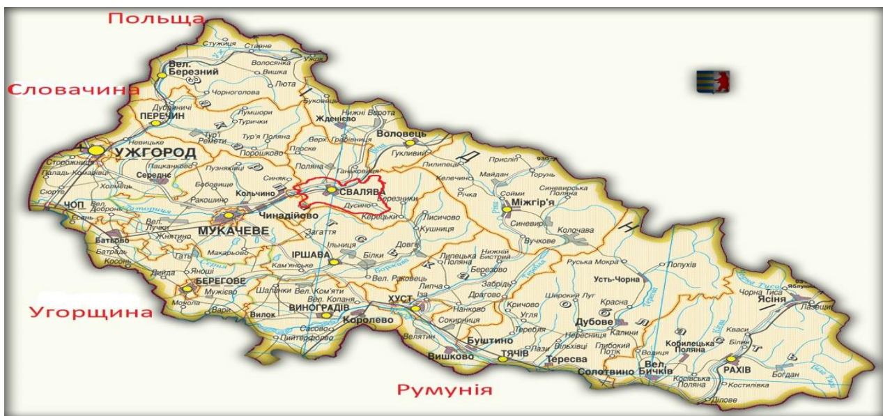
Рис. 2.1. Розташування Свалявської міської територіальної громади в Закарпатській області

Свалявська міська територіальна громада розташована в центральній частині Закарпатської області, на території Мукачівського району. Її географічне положення є стратегічно вигідним – поруч проходять важливі транспортні магістралі, а також знаходяться міжнародні пункти пропуску на кордоні зі Словаччиною та Угорщиною (рис.2.1).