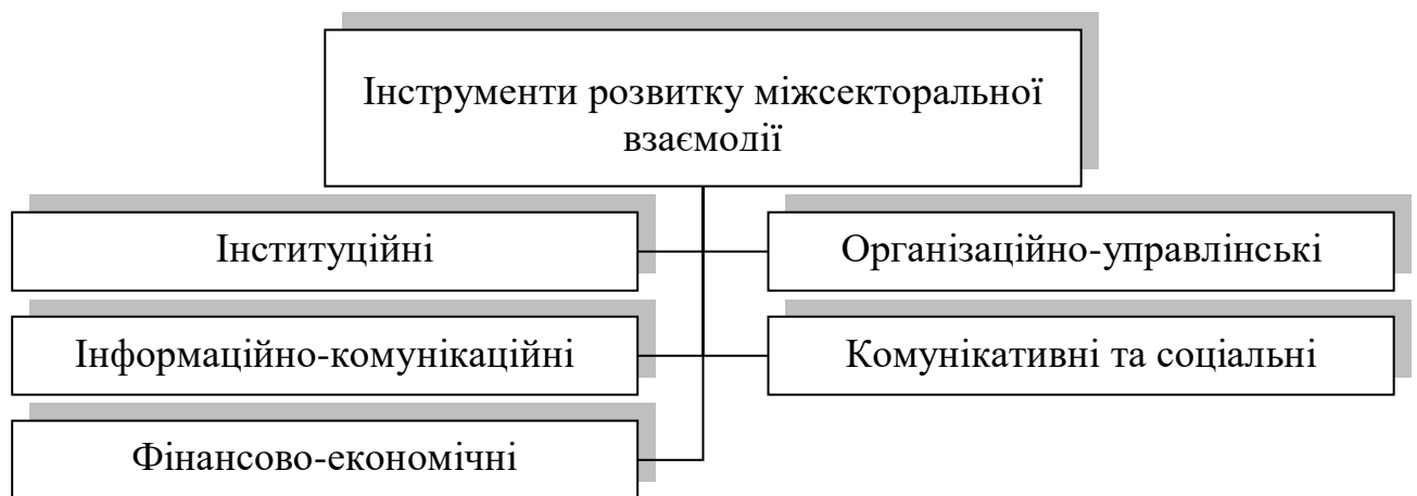
Рис.1.1. Інструменти розвитку міжсекторальної взаємодії в процесі управління розвитком територіальної громади

Розвиток міжсекторальної взаємодії в управлінні територіальною громадою передбачає використання цілого комплексу інструментів, які забезпечують організаційне, комунікаційне, фінансове та правове підґрунтя для ефективного партнерства між публічним, приватним та громадським секторами (рис.1.1). Кожна група інструментів виконує специфічні функції, що сприяють інституціоналізації взаємодії, підвищенню результативності управління та зміцненню спроможності громади реагувати на сучасні виклики. Їх застосування є ключовою передумовою формування цілісної системи локального врядування, орієнтованої на спільну відповідальність, інноваційність і залученість громадян.