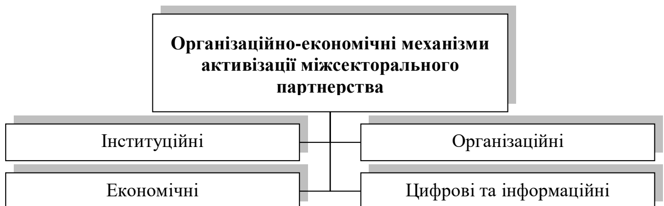
Рис. 3.2. Організаційно-економічні механізми активізації міжсекторального партнерства

З позицій публічного управління міжсекторальне партнерство: підсилює легітимність управлінських рішень за рахунок широкої участі стейкхолдерів; сприяє підвищенню інноваційності стратегічних рішень; створює інституційні умови для довгострокової співпраці. В умовах децентралізації саме партнерська модель стає визначальним підходом до забезпечення сталого розвитку громади, оскільки вона дозволяє долати структурні обмеження та мобілізувати потенціал локальних суб'єктів. Зазначимо, що у структурі організаційно-економічних механізмів активізації партнерства виокремлюють (рис.3.2):