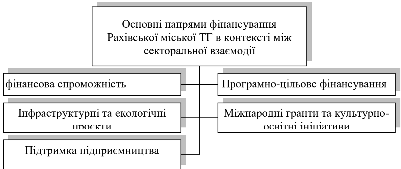
Рис.2.1. Основні напрями фінансування Рахівської міської ТГ в контексті міжсекторальної взаємодії

ставки місцевих податків і зборів, що враховують специфіку території та характер економічної діяльності» [20].