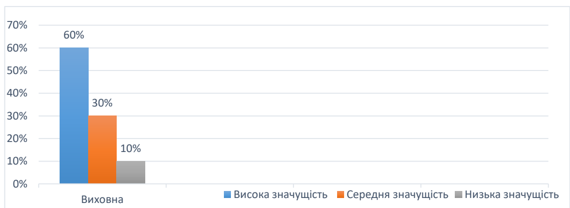
Рис. 3.2. Особистісні якості вчителя, що приводять до ефективного використання виховної функції

Кількісні опрацьовані дані, що стосуються виховної функції відображено на рис. 3.2.