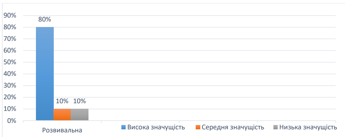
Рис. 3.3. Особистісні якості викладача, що приводять до ефективного використання розвивальної функції

Отож, отримані дані за допомогою анкетного опитування дозволяють констатувати, що аспіранти 2 року навчання сповна усвідомлюють, у майбутній викладацькій діяльності їм прийдеться сповна використовувати педагогічні функції: навчальну, виховну та розвивальну. Нами проведене дослідження на визначення значущості використання в освітньому процесі педагогічних функцій. Відповідно дані високої значущості відповідають високим % показникам (70%, 60% та 80%).