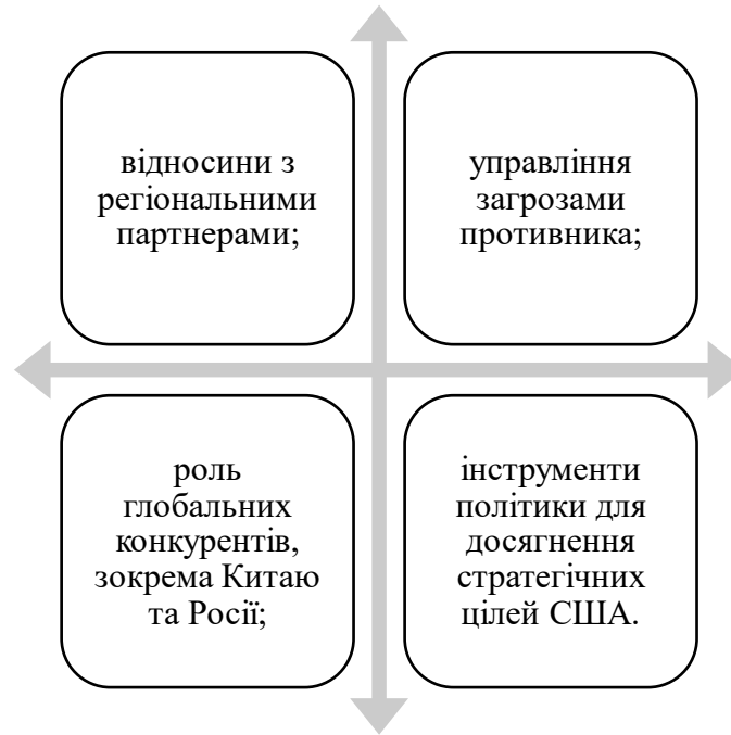
Рис. 2.1. Універсальні складові американської стратегії у Близькосхідному регіоні.