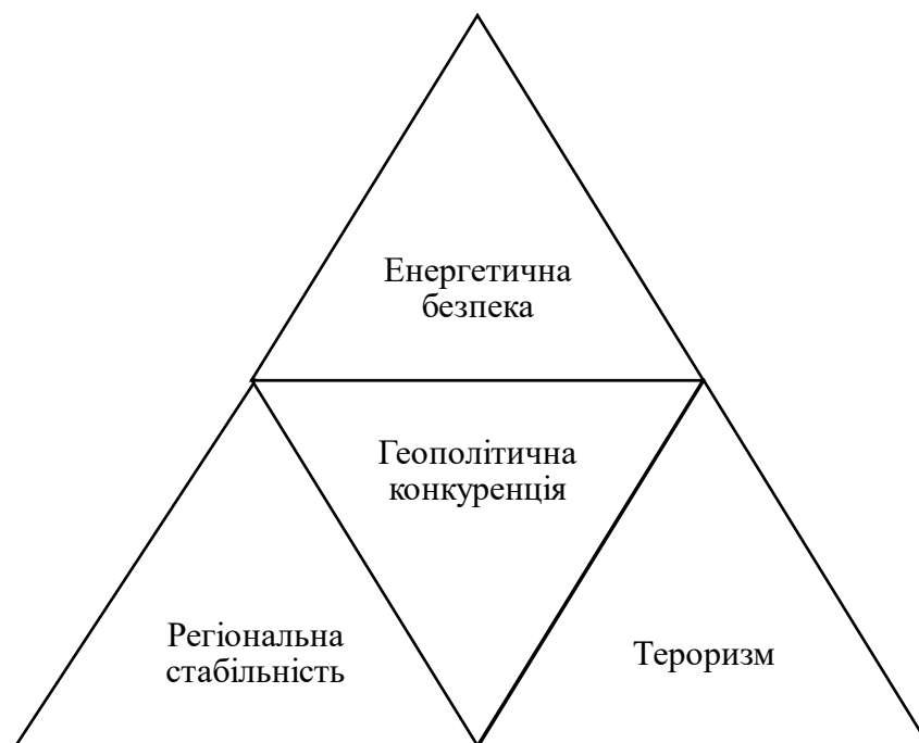
Рис. 1.1. Ключові чинники змін стратегії США на Близькому Сході.

Близький Схід завжди відігравав важливу роль у геополітичних стратегічних планах США. Його значення визначається багатими енергетичними ресурсами, стратегічним розташуванням між Європою, Азією та Африкою, а також роллю в глобальних політичних, економічних і безпекових процесах [17]. З часів Другої світової війни США розглядали цей регіон як ключову точку для реалізації своїх інтересів, але зміни міжнародної системи, внутрішні регіональні конфлікти, а також зовнішні виклики змушували Вашингтон періодично переглядати та адаптувати свою стратегію (рис. 1.1).